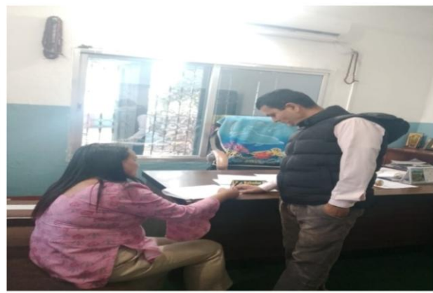
वडा नं. ९ इन्जिनियर सर सँग छलफल