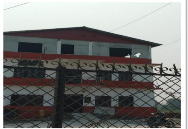
२ नं. वडा कार्यालयको भवन