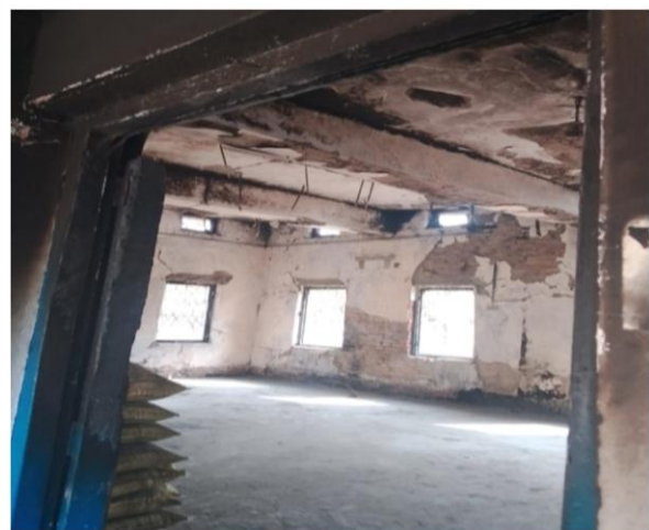
जेन्जि आन्दोलनमा वडा नं. ५ को कार्यालयमा भएको क्षति