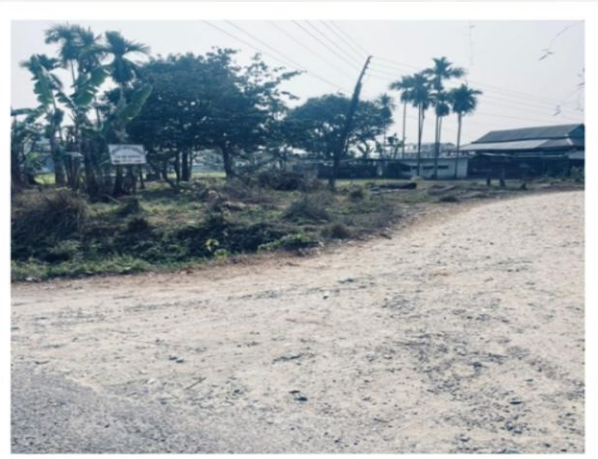
८ नं. वडा जाने ग्राबेल बाटो