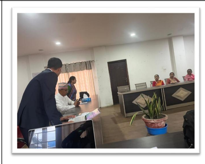
उर्लाबारी नगरपालिकाको सामाजिक परिक्षण प्रतिवेदन ०८१।०८२