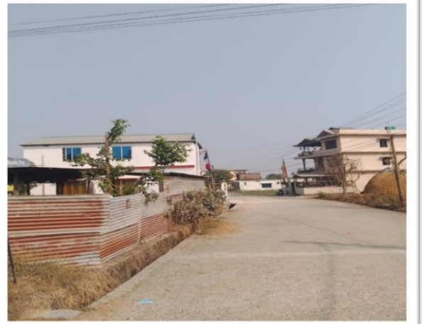
सप्तकोशी मार्ग ग्राबेल