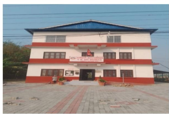
वडा नं. १ को कार्यालय