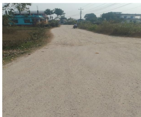
नुनसरी चोकको ग्राबेल बाटो वडा नं. १