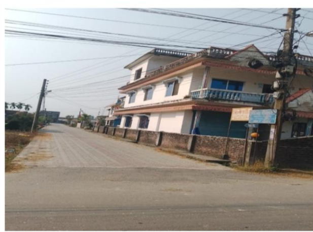
५ नं. वडाको सिर्जना टोल ब्लक निर्माण