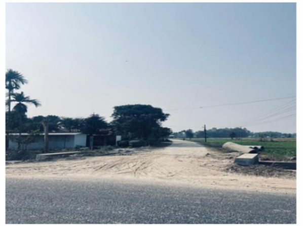
८ नं. वडा ग्राबेल बाटो खाइवा चोकको बाटो