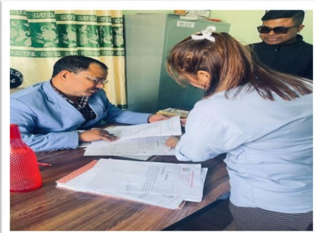
उर्लाबारी नगरपालिका वडा नं. ८ मा कार्यक्रमबारे छलफल