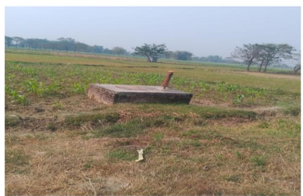
वडा नं. ९ मा अनुदानामा वितरण गरिएको पानितान्ने पम्प