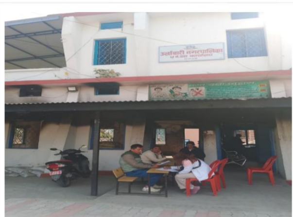
वडा नं. ५ को कार्यालयमा कार्यक्रमबारे छलफल