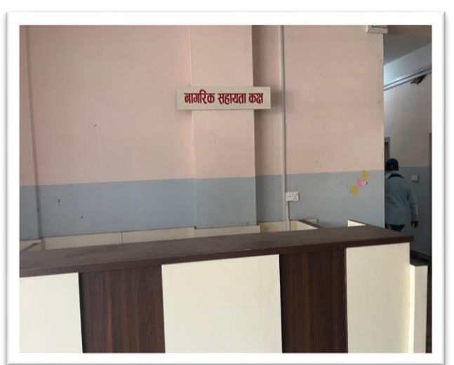
उर्लाबारी नगरपालिकाको सामाजिक परिक्षण प्रतिवेदन ०८१।०८२