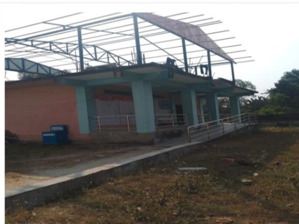
५ वडा कार्यालयका लागि स्वास्थ्यको भवनलाई निर्माण गर्दै